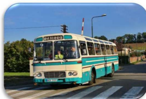
Karosa ŠD 11