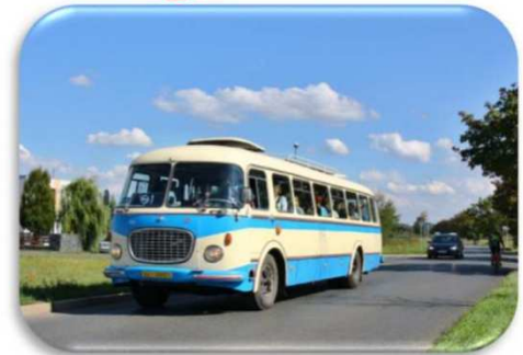
Škoda 706 RTO linkový