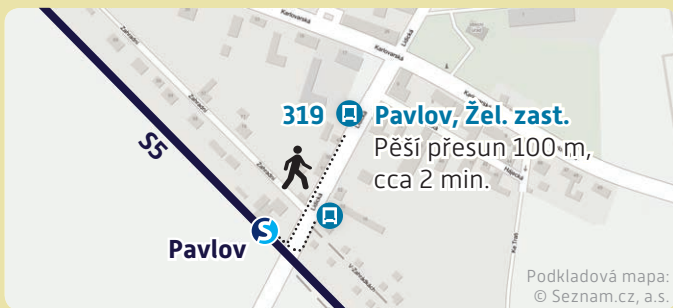
Schéma přestupu v Pavlově

Přejeme Vám příjemné cestování novými spoji na linkách Pražské integrované dopravy.