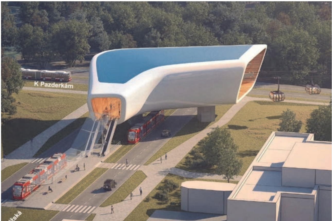
ilustrační obrázek