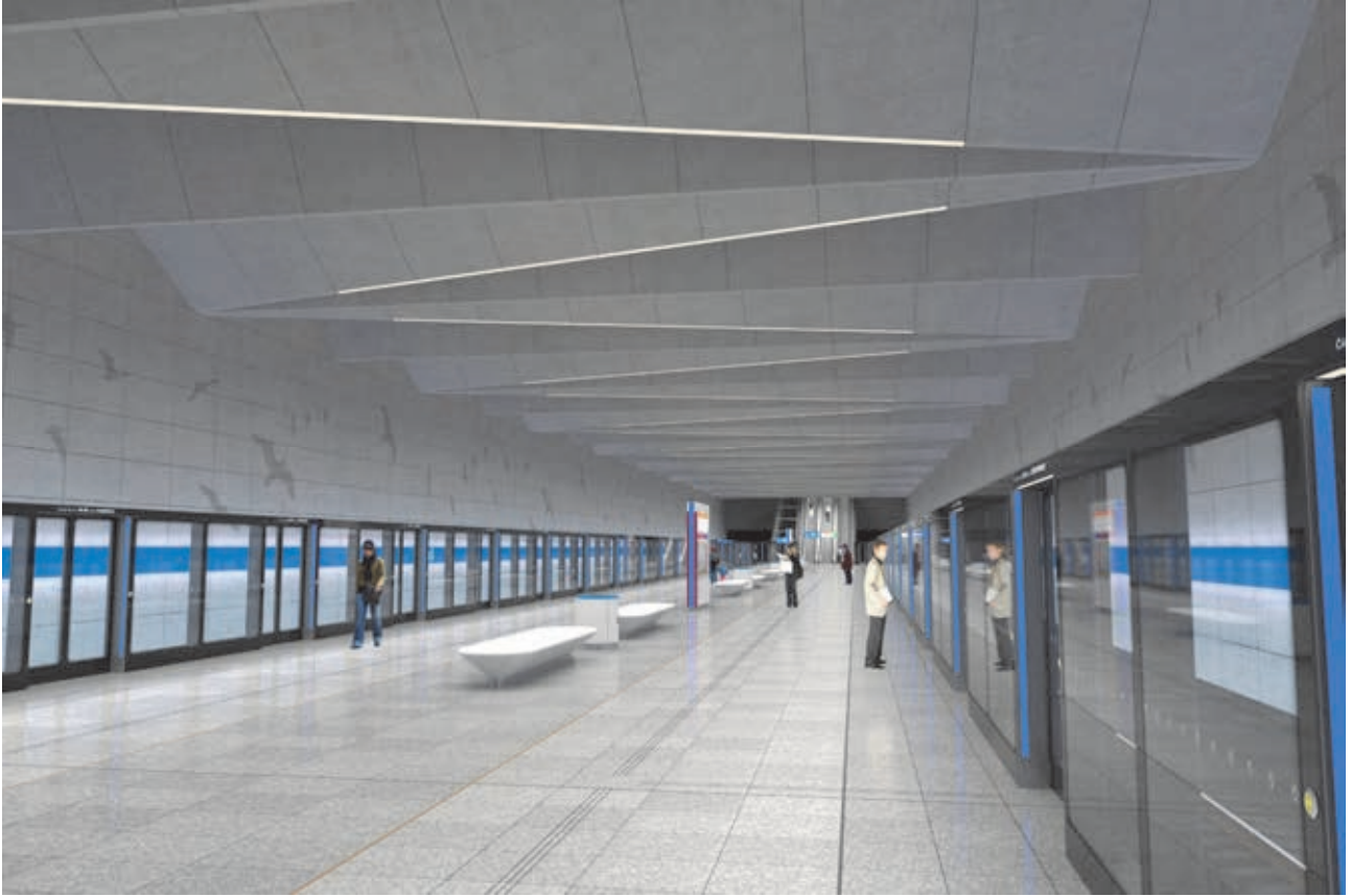
ilustrační obrázek