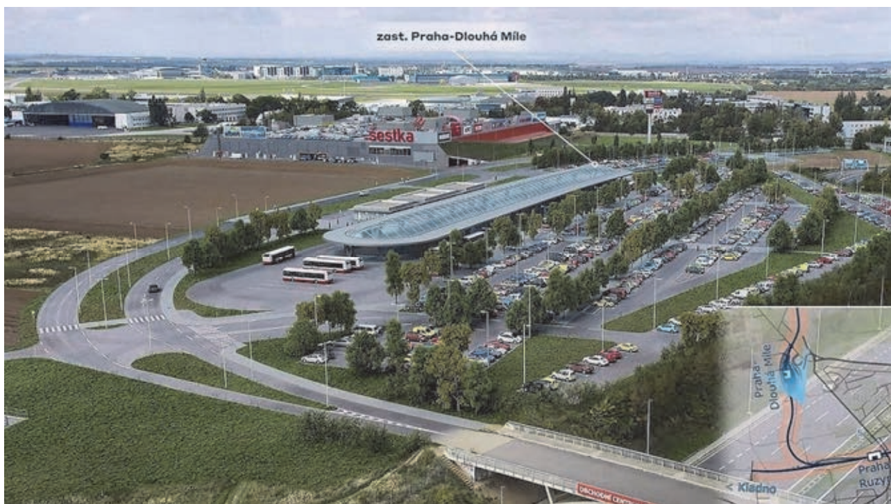
ilustrační obrázek